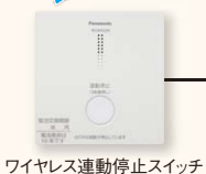
ワイヤレス連動停止スイッチ